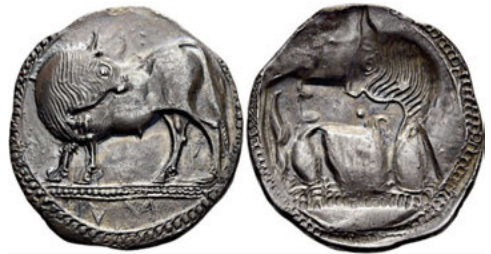
Los Nr. 112 SYBARIS. Didrachme. 550 - 510 v. Chr. Schätzung: 3.000 EUR Verkauf*: 8.750 EUR