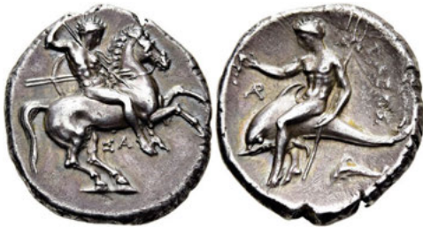
Los Nr. 97 TARENT. Didrachme. 332 - 302 v. Chr. Schätzung: 500 EUR Verkauf*: 6.875 EUR