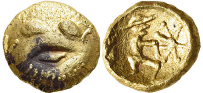
Los Nr. 78 BOIER. Typ mit Petasosträger. Stater. 2. Jh. v. Chr. Schätzung: 10.000 EUR Verkauf*: 12.500 EUR