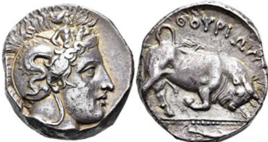
Los Nr.116 THOURIOI. Tetradrachme. 400 - 350 v. Chr. Schätzung: 2.000 EUR Verkauf*: 5.750 EUR