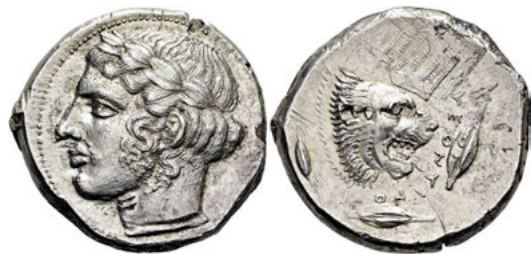
Los Nr. 139 LEONTINOI. Tetradrachme. Um 430 v. Chr. Schätzung: 2.000 EUR Verkauf*: 10.000 EUR